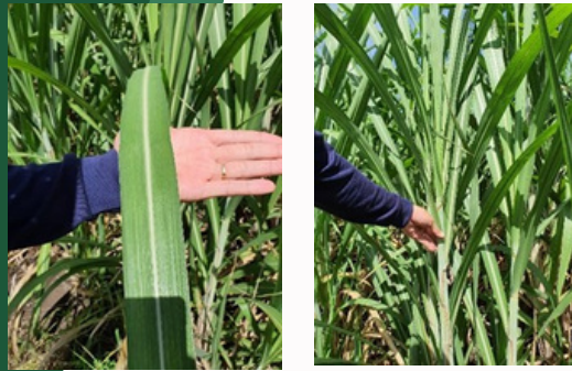
ใส่หินปะซอลต์ Micromite