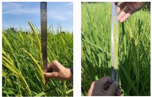
ใส่หินปะซอลต์ Micromite