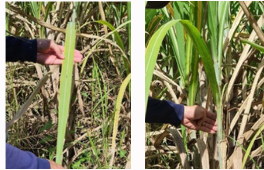
ไม่ได้ใส่หินปะซอลต์ Micromite